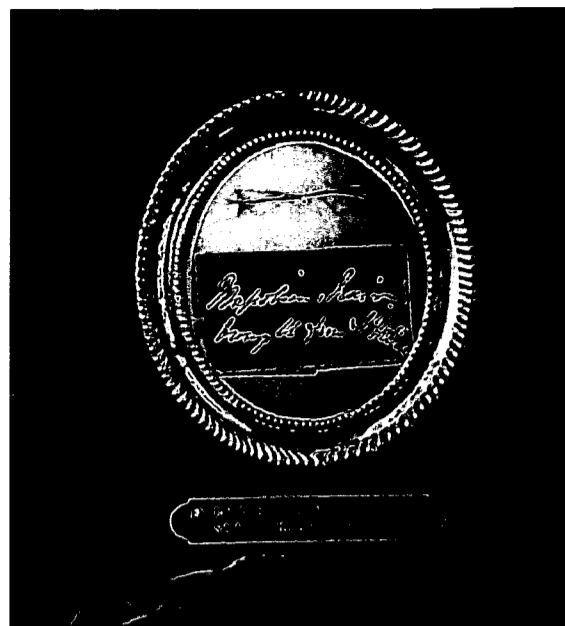
Figure 2 : Photo représentant le médaillon contenant la mèche de cheveux de Napoléon dite "lady Holland".

A partir d'une prise d'essai de 2 mg de cheveux, la